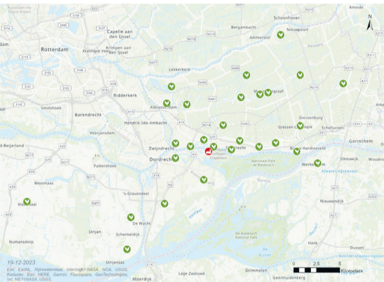
Kaart: locaties waar de eieren van hobbykippen geraapt en getest zijn. NB: dat er minder dan 30 bolletjes op de kaart staan, komt doordat enkele locaties dicht bij elkaar liggen.

Ruim driekwart van de geteste eieren van hobbykippen in de regio Zuid-Holland Zuid en Altena bevatten te hoge gehalten aan verschillende soorten PFAS bevatten. Dit blijkt uit een eerste analyse van het eieronderzoek, dat in opdracht van de gemeenten Dordrecht, Molenlanden, Papendrecht en Sliedrecht wordt uitgevoerd. Zowel het RIVM als de GGD Zuid-Holland Zuid adviseren mensen uit de regio uit voorzorg voorlopig geen eieren meer te eten van hobbykippen en vervolgonderzoek af te wachten. Eieren uit supermarkten en winkels zijn wel veilig.