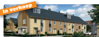
In verkoop 11 hoek- en tussenwoningen type Lavendel