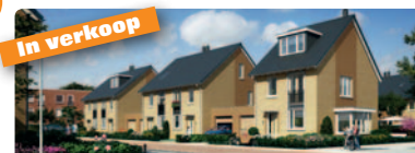
In verkoop 5 twee-onder-een-kap woningen type Dille Info: Bouwfonds Ontwikkeling