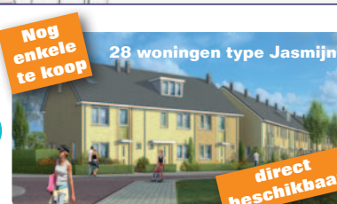
Nog enkele te koop 28 woningen type Jasmin direct beschikbaar 7 tussenwoningen 12 hoek- en tussenwoningen Info: Bouwfonds Ontwikkeling