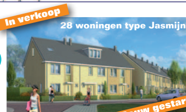
In verkoop 28 woningen type Jasmin Bouw gestart 9 hoek- en tussenwoningen Info: Bouwfonds Ontwikkeling