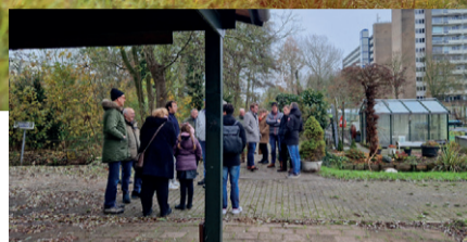
Noord-Zuidverbinding ► pagina 4