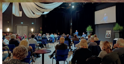
Binnenstedelijke Herstructurering Sliedrecht ► pagina 2