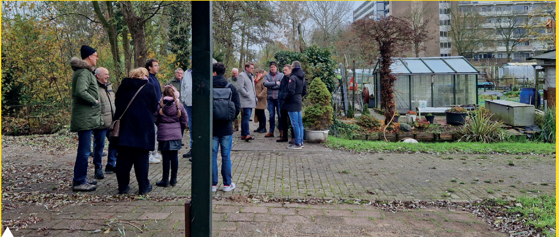
Een groep inwoners wandelde samen met een landschapsarchitect door het gebied van de Noord-Zuidverbinding.

Lees meer over deze wandeling en de klankbordgroep op sliedrechtbouw.nl