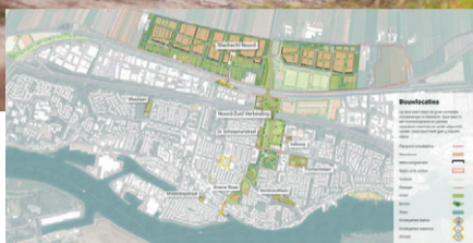
Sliedrecht-Noord ► pagina 3